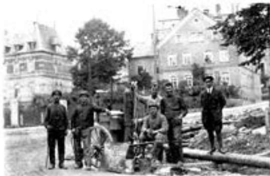
Anschluss Gas an Ferngaswerk Annaberg in Thum

Nach der politischen Wende in der ehemaligen DDR gelang es der Stadt Annaberg-Buchholz erst nach umfangreichen Rechtsstreitigkeiten, gemeinsam mit anderen Städten und Gemeinden das jeweilige Eigentum an den kom-