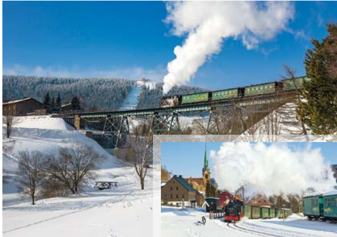
Fichtelbergbahn auf dem Viadukt, Fotos: Sandro Lindner

Zur erfolgreichen Entwicklung trugen auch die beliebten Sonderfahrten bei, die als Publikumsmagnete den regulären Fahrbetrieb ergänzen. Um den Gästen ein attraktives Angebot bieten zu können, wird neben