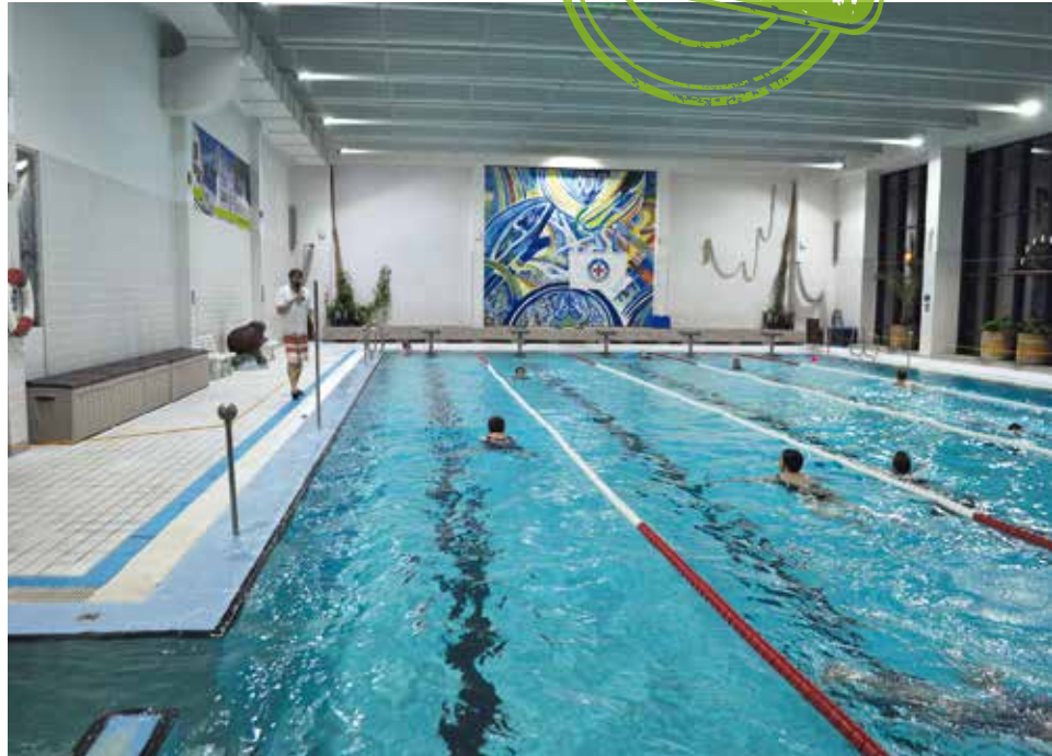
Am Abend wird es in der Halle meist ruhiger, aber nicht weniger motiviert. Vielleicht Anlass für Einige, dieses Jahr genau dann noch einmal vorbeizuschauen?