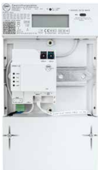
Die Komponente zur Weiterleitung der Messdaten befindet sich im inneren der neuen elektronischen Stromzähler. Sie ist auf der hier zu sehenden Schiene befestigt und kaum größer als ein FI-Schalter. Via Kabel oder auch per Funk wird sie mit dem eigentlichen Zähler verbunden.

Für das Gelingen der Energiewende setzen Gesetzgeber und Umweltverbände auf die Vorteile der Digitalisierung. Dazu zählt auch die Reformierung der Elektrizitätszähler, so Expertenmeinungen.