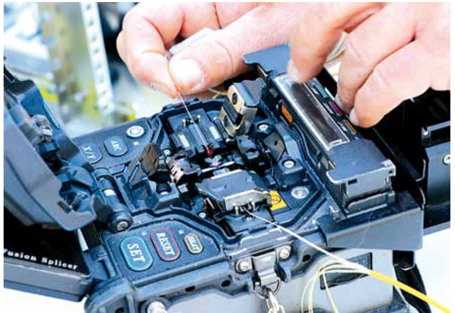
Einlegen der Glasfaser in das Spleißgerät.

und die Internetverbindung steht, können Sie mit High-speed online gehen“, so Maik Graubner.