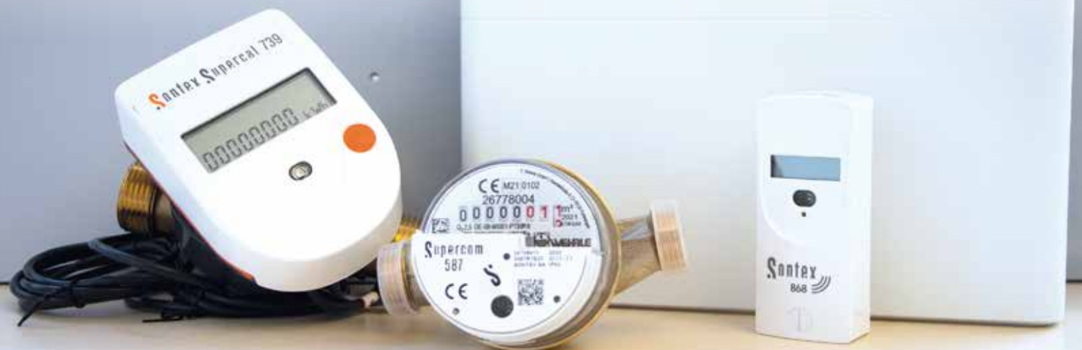
Die notwendigen Geräte im Überblick (v.l.n.r.) – Wärmemengenzähler, Wasserzähler, Elektronischer Heizkostenverteiler sowie das Gateway im Hintergrund.

Heizenergie und somit letztendlich CO 2 einzusparen. Die Umsetzung der Fernablesbarkeit von Messgeräten ist unabdingbar für die Einhaltung der Anforderung. Aus diesem Grund dürfen ab Tag des Inkrafttretens der Heizkostenverordnung nur noch Zähler und Heizkostenverteiler mit dieser Funktion installiert werden. Bereits verwendete Geräte, die diese Möglichkeit nicht bieten, müssen bis zum 1. Januar 2027 nachgerüstet oder gegen neue ausgetauscht werden. Zudem wurde beschlossen, dass unter anderem auch Informationen zum Brennstoffmix und den CO 2 -Emissionsdaten sowie Vergleiche der Energieverbräuche zum Vorjahr, aber auch grafische Übersichtselemente in die Abrechnung aufgenommen werden. Die Vorteile für Endnutzer und Gebäudeeigentümer liegen dabei klar auf der Hand – mehr Transparenz beim tatsächlichen Energieverbrauch und regelmäßige Verbrauchsinformationen, ohne dass ein Ableser Termine mit den Endnutzern vereinbaren oder die Nutzereinheit betreten muss.