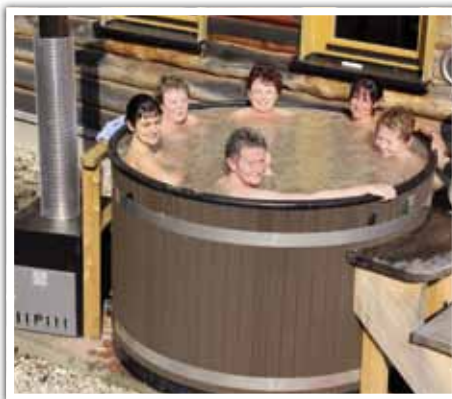
Das Restaurant Atlantis

Außengelände, Ruheräume sowie ein gemütlicher Gastronomiebereich runden das Angebot ab. Freundliche, individuelle Betreuung mit zelebrierten Aufgüssen sowie moderate Preise ohne Zeitbegrenzung machen die Saunalandschaft selbst für weitgereiste Gäste attraktiv.